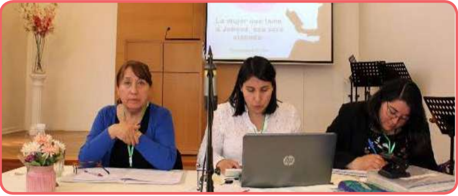
Mesa transitoria de convención