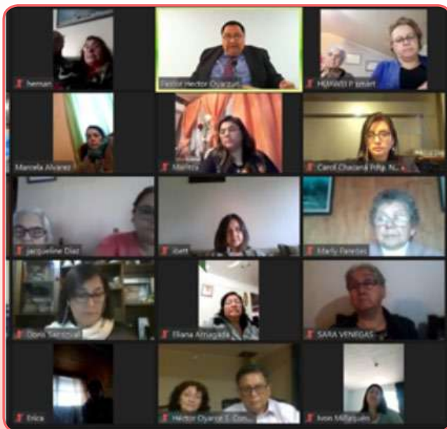
Culto de oración nacional