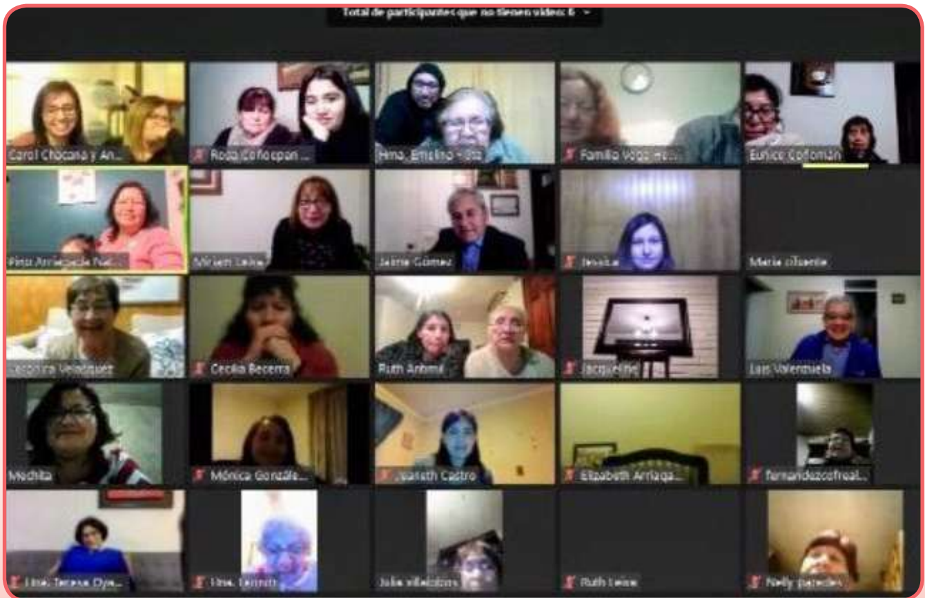
Culto de oración