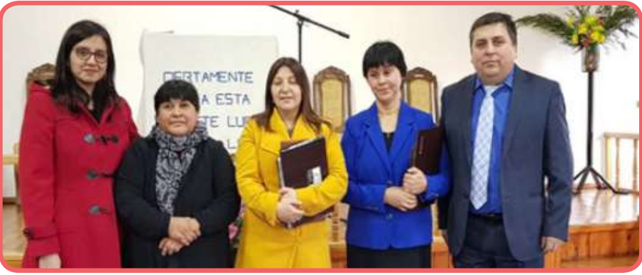
Departamento Femenino Vaso Frágil, inaugurado 10-08-2019