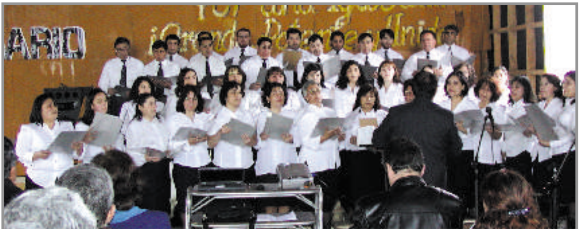
Coro Unido Iglesias de Valdivia septiembre 2004