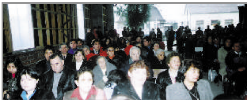
Hermandad Culto Aniversario 2004